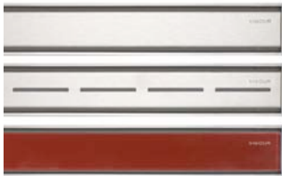
Bild 1: Die neue cosima Duschrinne gibt es in verschiedenen Edelstahl- und Glasvarianten. Neben Rot sind weitere Glasfarben lieferbar.