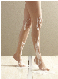
Bild 2: Die neue cosima Duschrinne gewährleistet optimalen Abfluss von Wasser und Seife.