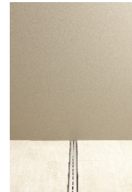
Bild 3: Grenzenlos elegant – die neue cosima Duschrinne von VIGOUR.